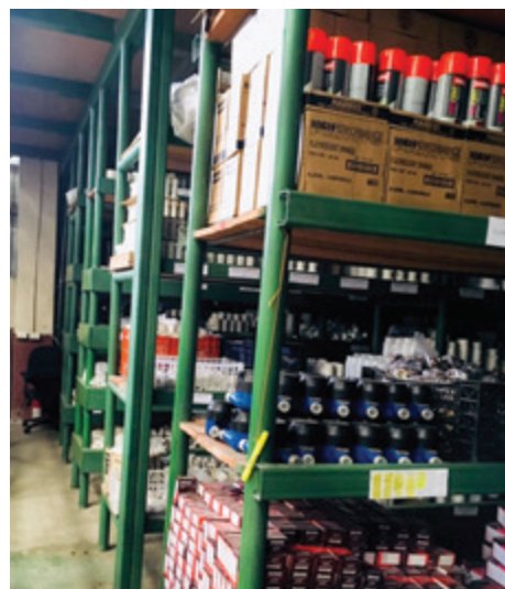
Estantes para inventario en bodega.

del Plantel, compra e instalación de sistema de vigilancia, con cámaras de seguridad y la implementación de mejoras eléctricas en el taller mecánico de la Unidad Técnica.