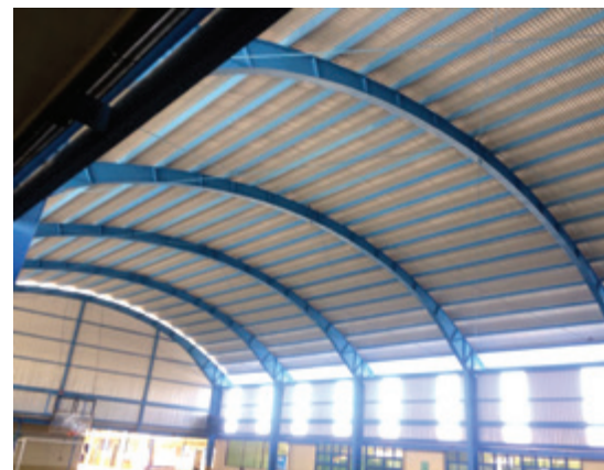
Colocación de techado en gimnasio de Escuela Juan Chaves Rojas.