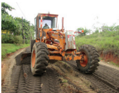
Coopevega de Cutris.