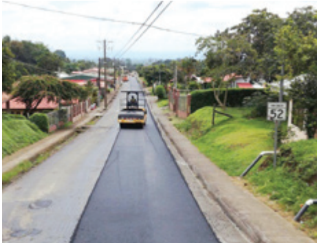
Corazon de Jesus, Venecia.