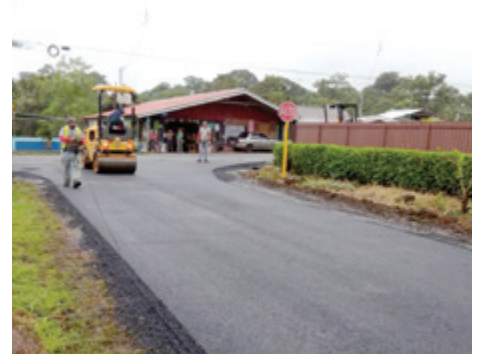
La Lucha de la Tigra.