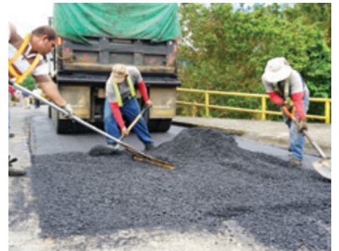
Puente Coocique, Ciudad Quesada.