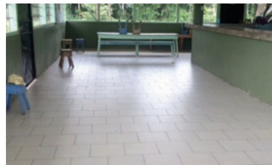
Colocación de cerámica, cocina comunal Santa Elena, Pital.