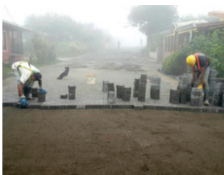
Adoquinado San Vicente Ciudad Quesada.