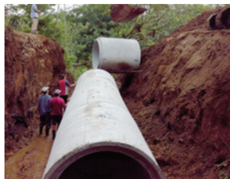
Evacuación pluvial, La Tesalia, Ciudad Quesada.