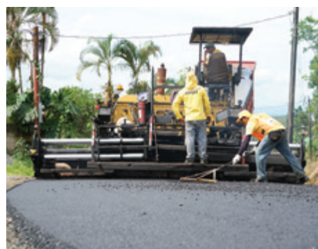
Barrio San José, Venecia.