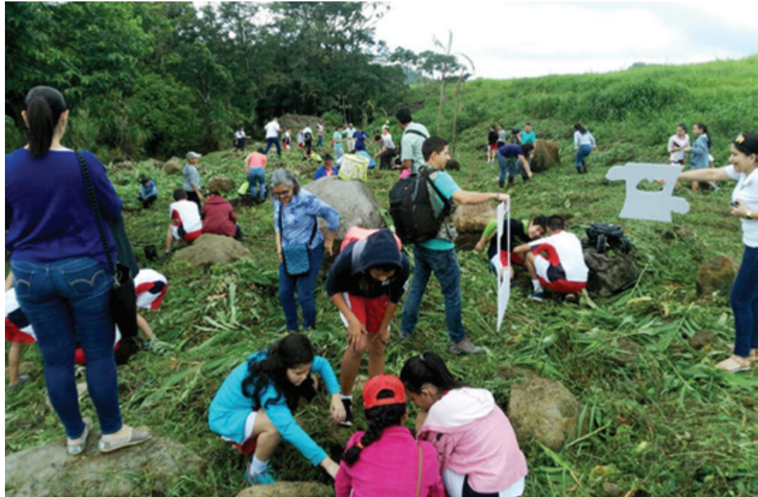
Reforestación en las faldas del Parque Nacional del Agua Juan Castro Blanco.

Son muchos los esfuerzos que hace el municipio sancarleño en pro del ambiente, de ahí que este galardón viene a confirmar el buen trabajo realizado durante los últimos años.