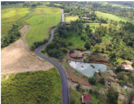
La Tesalia, Ciudad Quesada.