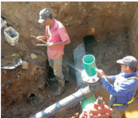
Instalación tubería nueva.

En la actualidad, la red hídrica municipal tiene 10 167 previstas de agua, con un consumo promedio de ₡7 500.