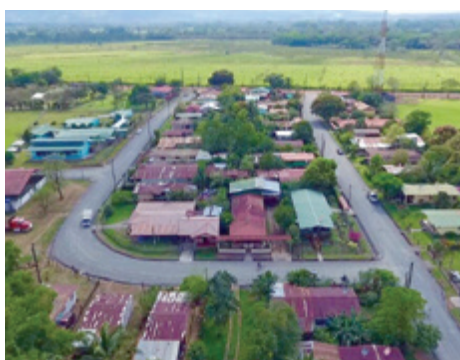
Los Llanos, Aguas Zarcas.