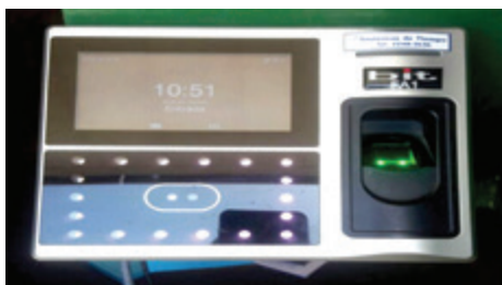
Equipo de vigilancia con cámaras de seguridad.

El monto de $32 millones invertidos en el Plantel Municipal se dieron en trabajos y equipos como la construcción de estantes y acomodo de inventario en la Bodega, asfaltado del parqueo, compra y ubicación de reloj marcador en el puesto de seguridad