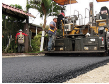
La Caporal, Aguas Zarcas.