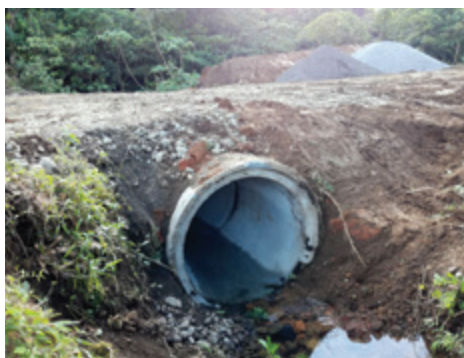
Colocación de alcantarillas reforzada, Santa Lucía de Venado.