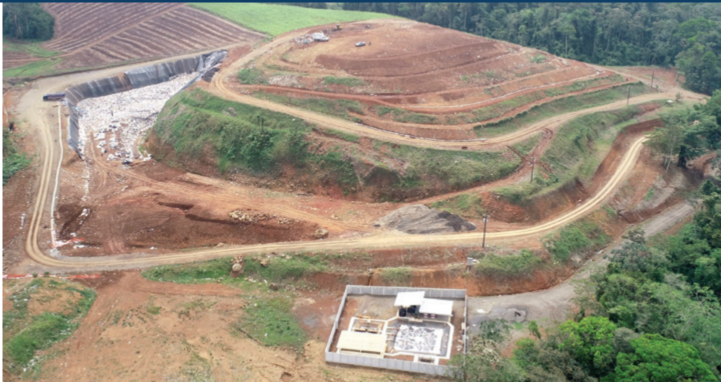
Vista aérea del vertedero municipal, donde destaca la trinchera y planta de lixiviados.