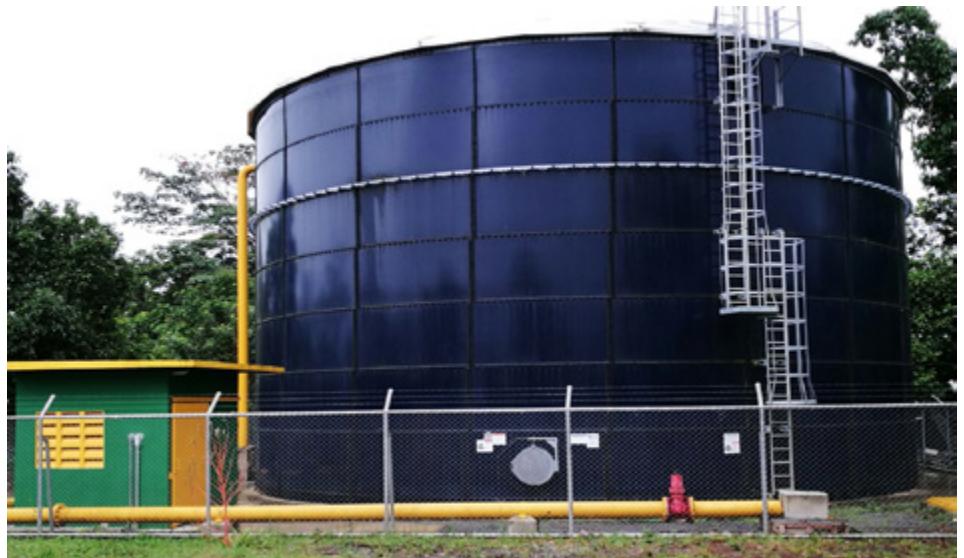
Mega tanque de almacenamiento de Pital. 2000m 3 .