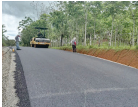
La Union de Monterrey.