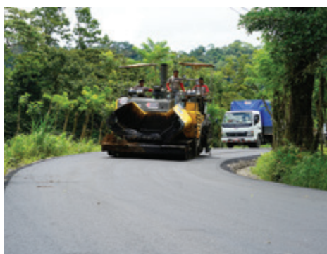
La Fortuna - Alto Monterrey.