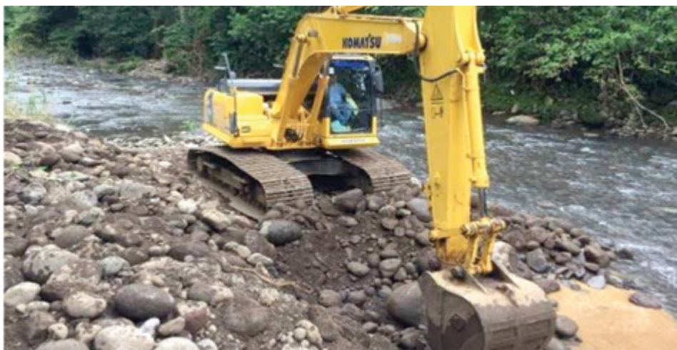
Obras de mejoras en caminos tras afectación por emergencia.

La Comisión de Emergencias de la Municipalidad de San Carlos, durante el 2017 invirtió ¢18 772 680 en la atención de emergencias y eventos naturales. El trabajo abarcó inspecciones, atención de caminos con daños, coordinación y ejecución de reuniones y proyectos, además de capacitaciones en cuanto a prevención y atención de emergencias.