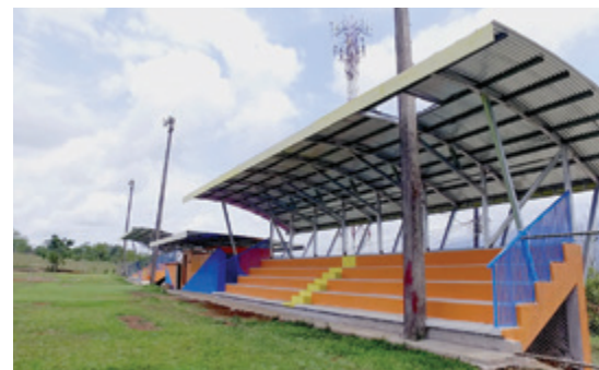
Graderías cancha de La Palmera.