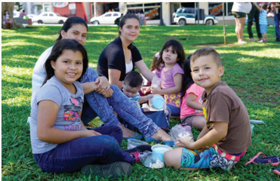
Área de recreación, Parque Central de Ciudad Quesada.

Otra de las inversiones se dieron en Cordón y Caño, cercado de propiedades municipales y el aseo de vías y sitios públicos.