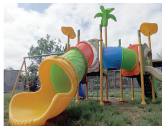
Parque infantil, Venecia.