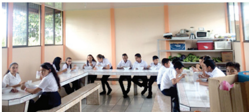
Comedor escuela El Saíno.