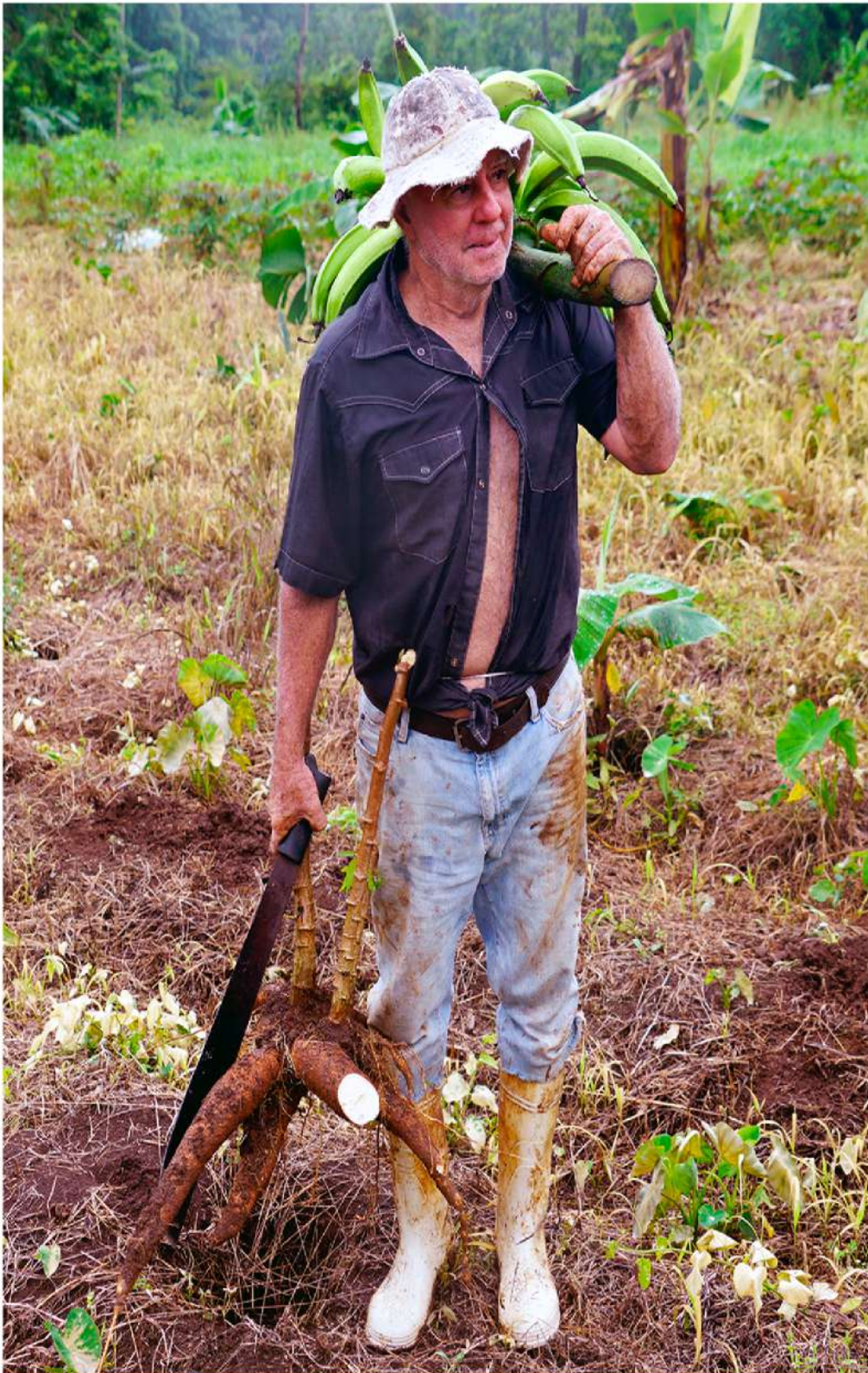
Pequeños productores beneficiados