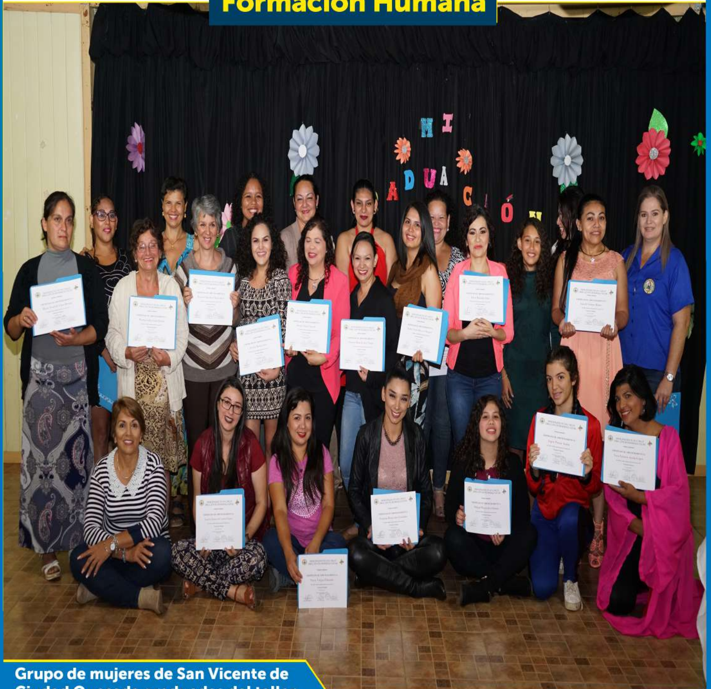
Grupo de mujeres de San Vicente de Ciudad Quesada graduadas del taller

El taller de Formación Humana impartido por la Municipalidad de San Carlos pretende ser una ayuda para que las mujeres conozcan sus potenciales, en las cinco áreas de salud integral del ser humano: emocional, racional, social, físico y espiritual ; ayudándoles a desarrollar empoderamiento y seguridad en sí mismas, como una forma de prevenir e erradicar cualquier acto de violencia .