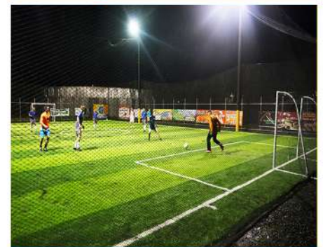
Deporte, recreación, salud